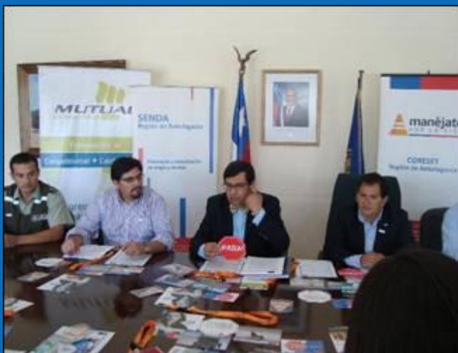
Reunión con Prensa para difundir programa Regional CORESET