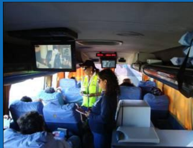
Control Buses Interurbanos - Uso Cinturón de Seguridad - Reflectancia